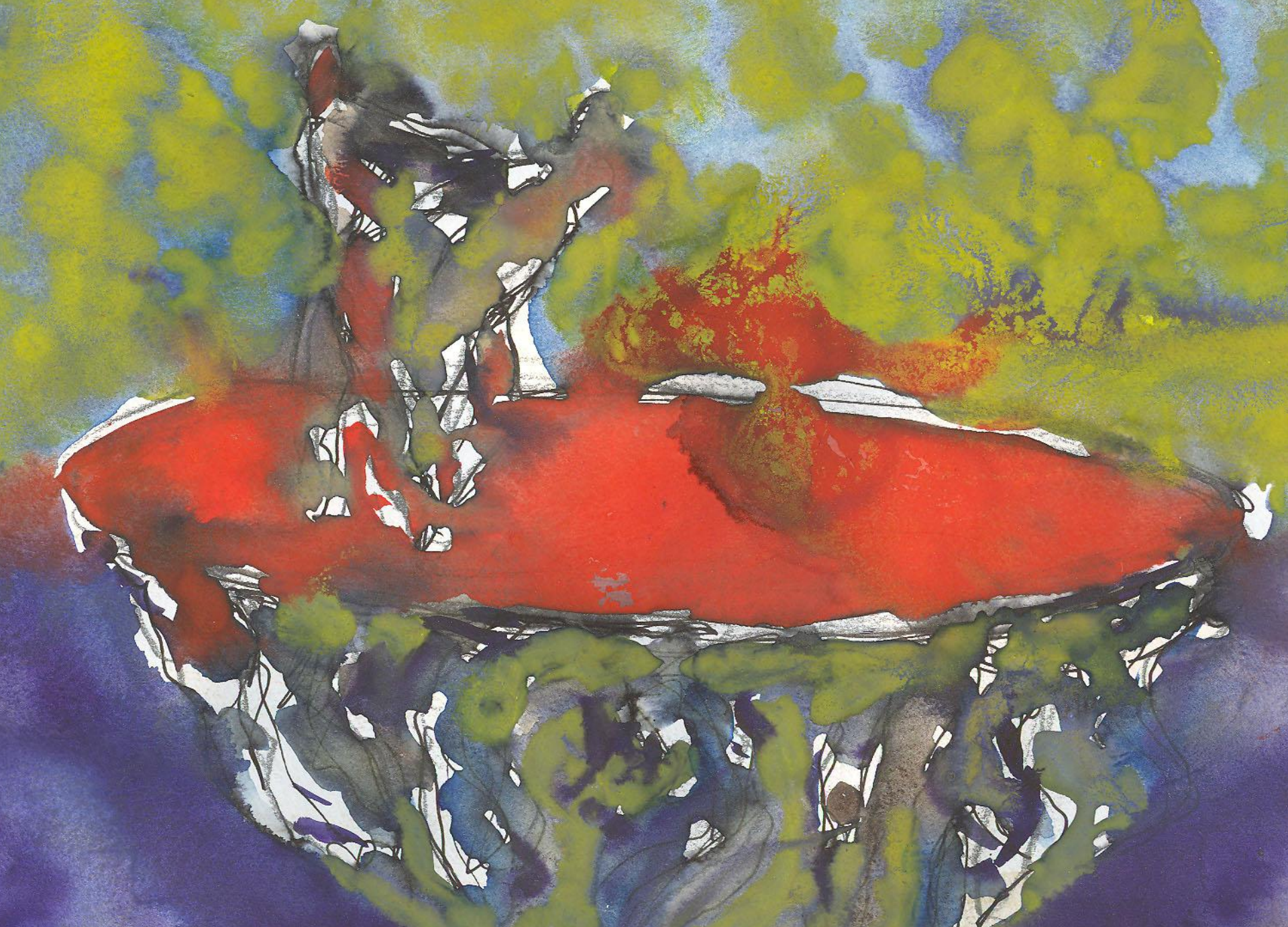
Artwork by Kari Nuutinen