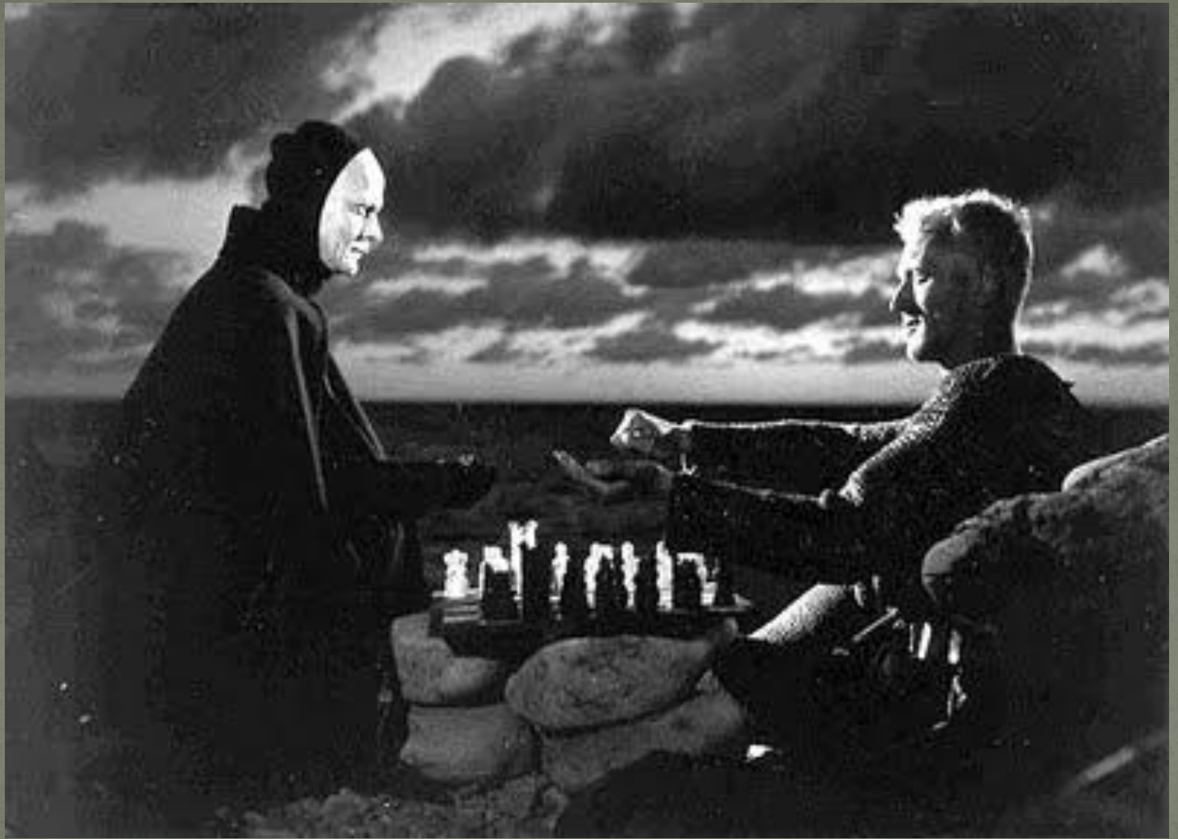
Ingmar Bergman: Seitsemäs sinetti

http://www.youtube.com/watch?v=f4yXBligZbg